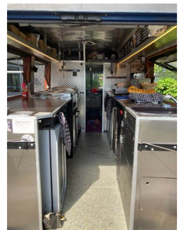
Onze bus is goedgekeurd door de Nederlandse Voedsel- en Warenautoriteit (NVWA)

*Voor feestjes heb ik 2 aparte groepen nodig (2x 220W) bijvoorbeeld de stekker van de wasmachine en de droger. Ik heb geen water aansluiting nodig en neem alle rotzooi weer mee terug. Voor festivals heb ik 1x 16 of 1x 32A kracht nodig en water (ergens in de buurt).